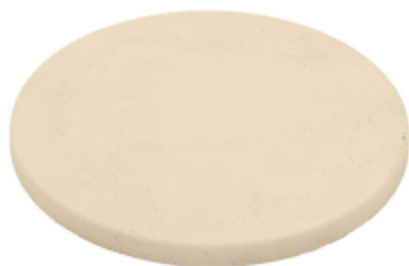
Камень для пиццы